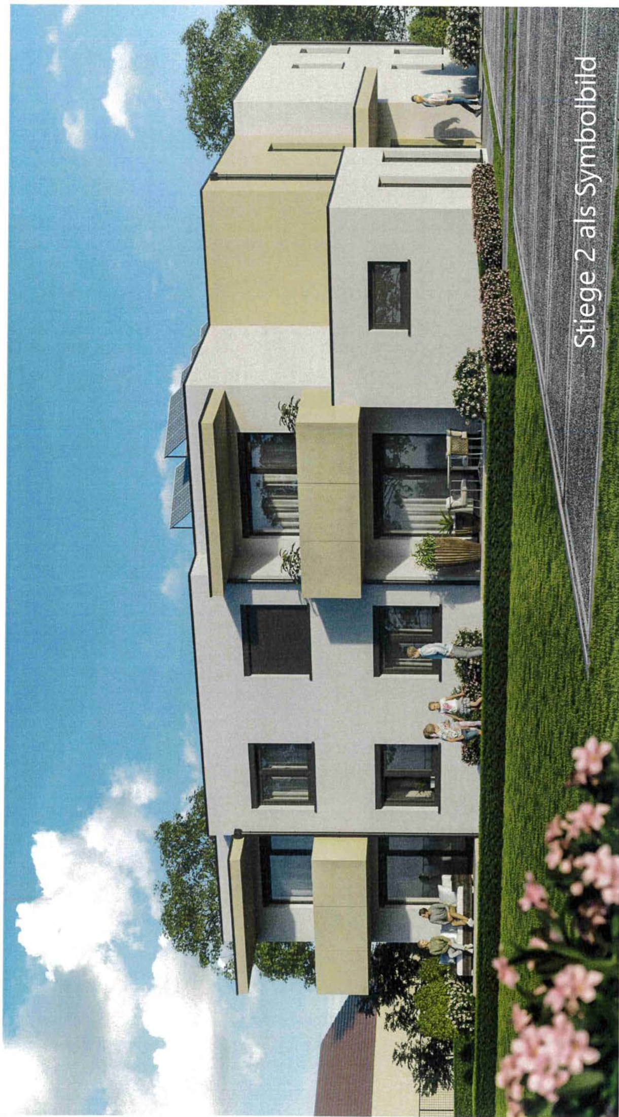
Stiege 2 als Symbolbild